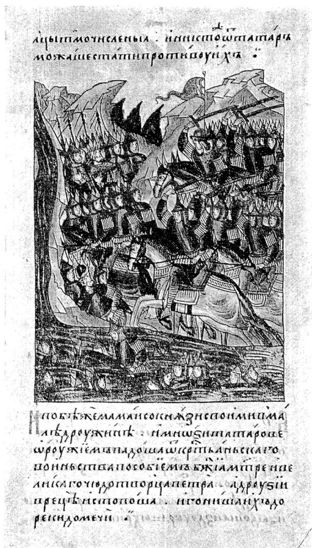
Победа над Мамаем

Победа на Куликовом поле еще более подняла значение