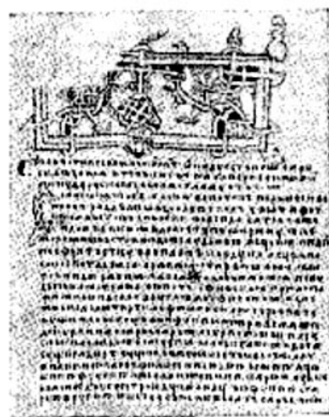
«Повесть временных лет» (по Лаврентьевскому списку 1377).

Списков Л. дошло не менее 1500. Большинство древнейших Л. сохранилось в относительно поздних списках. Наиболее ранние списки Л.: Синодальный список Новгородской 1-й Л. (13—14 вв.), Лаврентьевская Л. (1377), Ипатьевская Л. (15 в.), Радзивилловская Л. (15 в., 617 миниатюр). Записи историч. событий начали вестись, по-видимому, уже в конце 10 в. в Киеве, но самый жанр Л. с типичным для него изложением по годам возник не ранее сер. 11 в. Новгородские Л. начали составляться в 11 в. В нач. 12 в. в Киеве была создана летопись, не знавшая себе равных в тогдашней Европе по мастерству повествования, разнообразию привлеченных источников (русских, византийских, южно- и зап.-славянских) и сложности историч. сознания — «Повесть временных лет». В 12 и нач. 13 вв., кроме Киева и Новгорода, Л. ведутся в Галиче, Владимире Волынском, Чернигове, Переяславле Южном, Ростове, Владимире и Переяславле Залесских и др. В годы нашествия Батюга созданы выдающиеся повествования о битве на Калке, взятии Владимира Залесского и пр., однако в целом количество Л. уменьшилось. По-