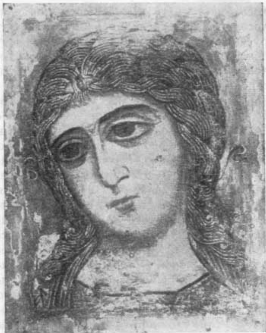
Архангел Гавриил. «Ангел Златые власы». Начало XII — начало XIII в.

Несмотря на то что политика ольговичей претерпела резкие изменения еще с самого начала 80-х годов, Игорю Святославичу не сразу пришлось участвовать в походе против своего бывшего союзника Кончака. В 1183 г. объединенными усилиями русских князей под предводительством Святослава Всеволодовича половцы были разбиты. Было взято 700 пленников, захвачены военные машины, отбиты русские пленники, попал в плен хан Кобяк Карлыевич. В этом походе Игорь не участвовал. Он ходил са-