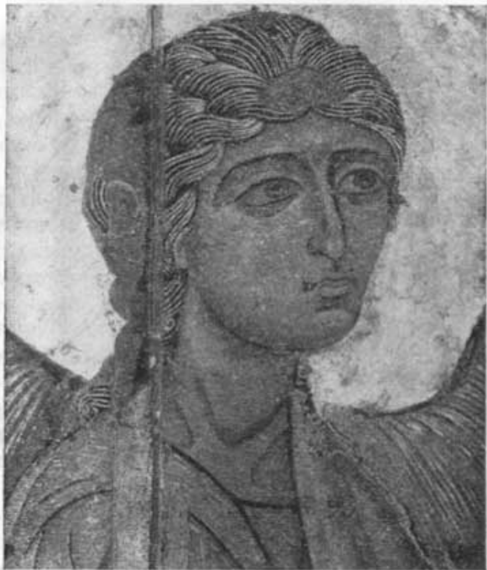
Архангел Гавриил. Деталь иконы «Благовещение Устюжское» из Георгиевского собора Юрьева монастыря в Новгороде. 1119 — начало XIII в.

Под влиянием половецкой опасности (как впоследствии под влиянием опасности монголо-татарской) зреют идеи необходимости единения, находящие отчасти выражение и в реальной политической жизни, несмотря на почти полную утрату единства экономических интересов, поддерживавших когда-то — в XI в. — объединительную политику Киева. Носителями идеи объединения были прежде всего демократические слои русского населения. Однако идеи эти находят теперь деятельную поддержку и в среде князей.