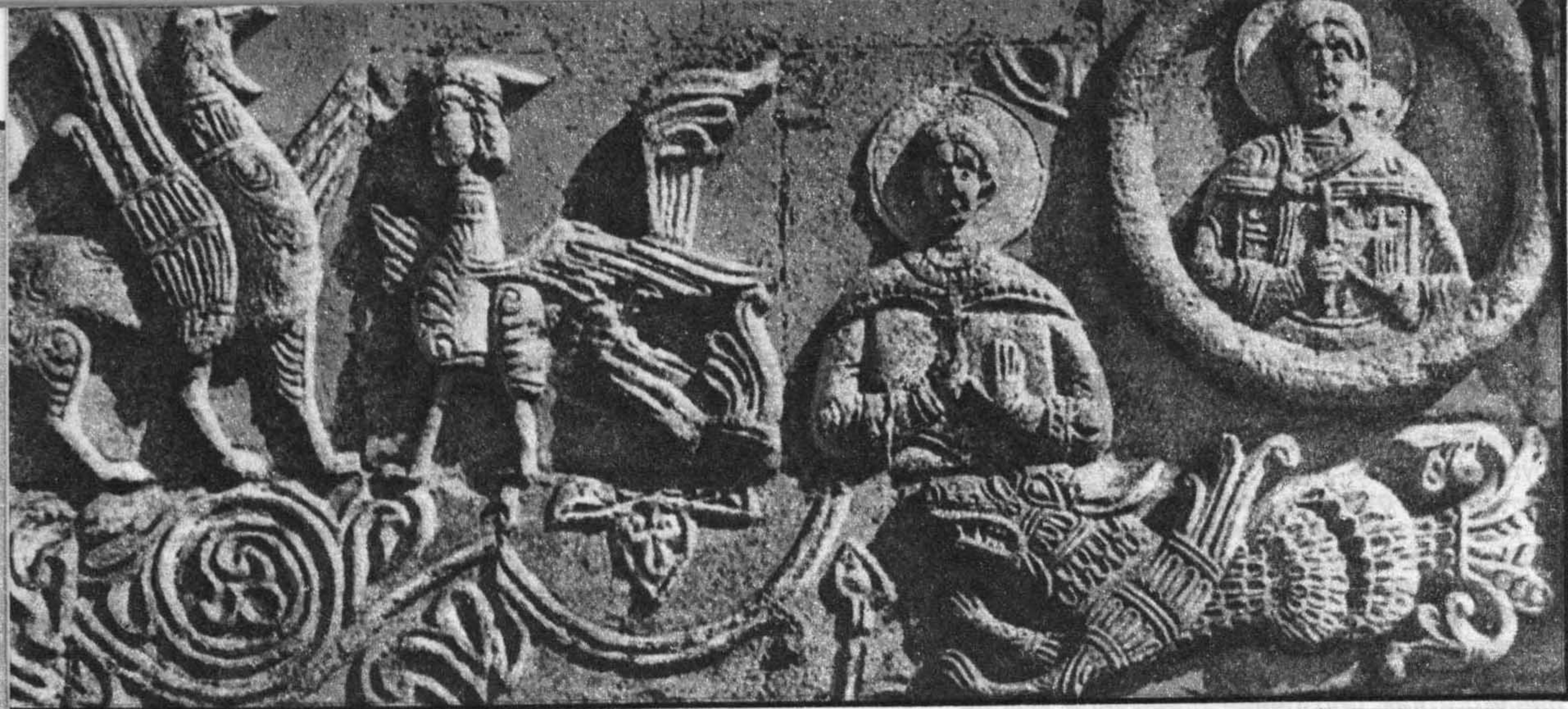
Рельефы Георгиевского собора в Юрьеве-Польском. 1234 г.