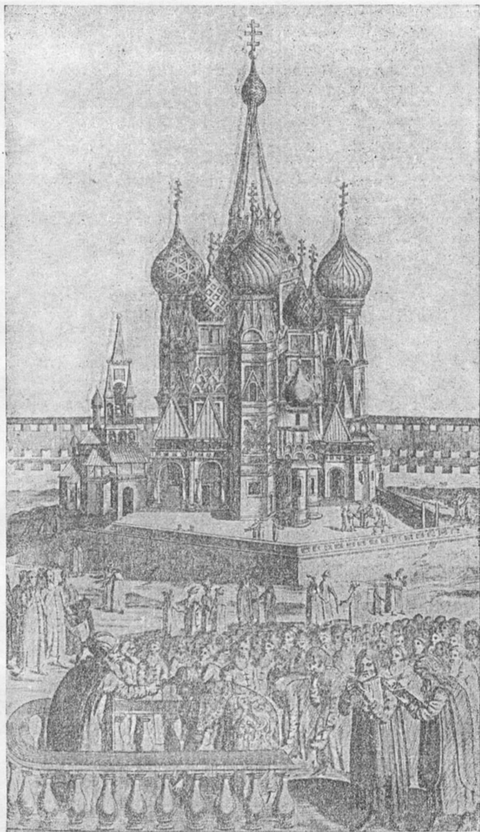
Собор Василия Блаженного. 1555—1560 гг. Гравюра из книги: Adam Olearius. Voyages très curieux et très renommez faits en Moscovie, Tartarie et Perse... A Leide, 1719.