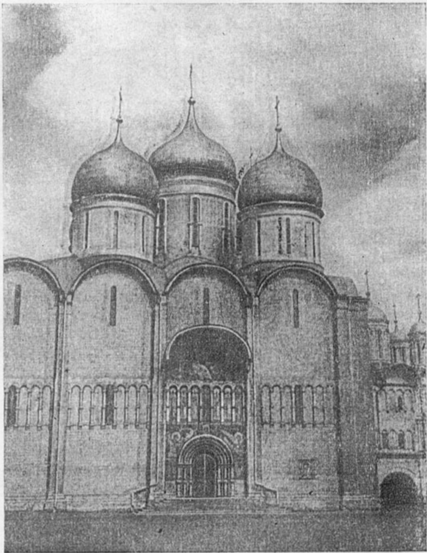
Успенский собор в Московском кремле, 1475—1478 гг.

Отчетливее, чем другое какое-либо искусство, зодчество конца XV—начала XVI в. отразило возросший международный авторитет Руси, явилось воплощением идей эпохи, широких и дальновидных надежд русских людей на блестящее будущее своего народа.