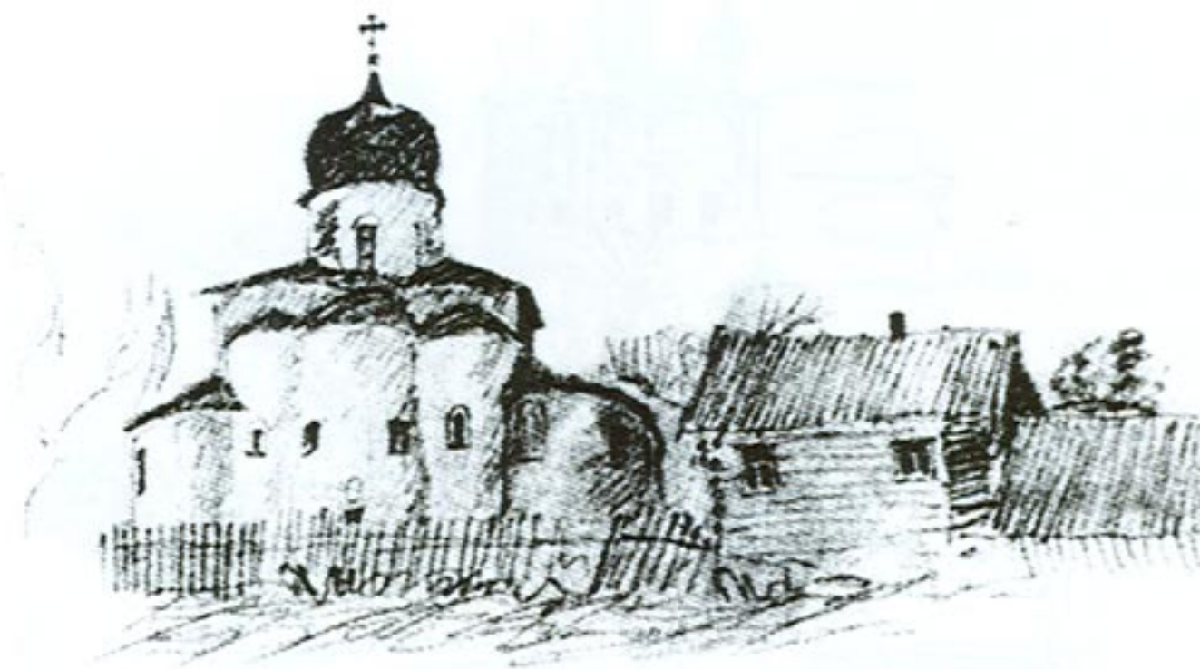
Ильма на Лавке

Русская земля, вернее, земля «Русьская», то есть вся — с будущей Украиной, Белоруссией и Великороссией — была сравнительно слабо населена. Жители страдали от вынужденной разобщенности, селились преимущественно по торговым путям — рекам, селились деревнями, не такими уж большими, боялись окружающей неизвестности. Враги приходили «из невести», степь являлась «страной незнаемой», западные соседи — «немцы», то есть народы «немые», говорящие на незнакомых языках. Поэтому среди лесов, болот и степей люди стремились утвердить свое существование, подать о себе знак высокими строениями церквей, как маяками, ставившимися на излучинах рек, на берегах озер, просто на холмах, чтоб их было видно издали.